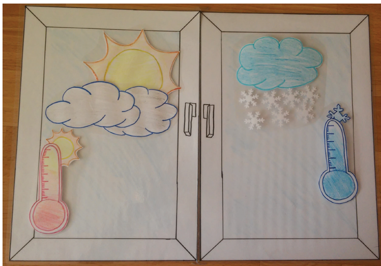
Załącznik 2. Okno z pogodą