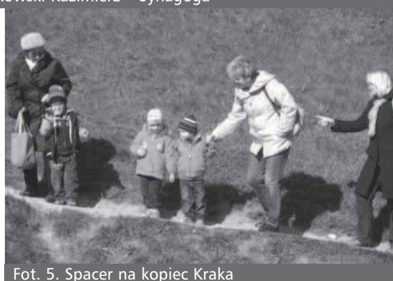
Fot. 5. Spacer na kopiec Kraka