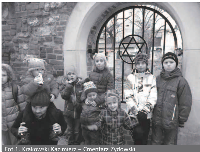
Fot. 1. Krakowski Kazimierz – Cmentarz Żydowski