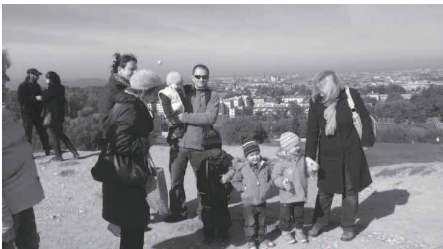
Fot. 3. Spacer na kopiec Kraka