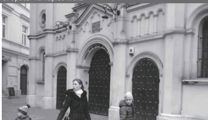
Fot. 4. Krakowski Kazimierz – Synagoga