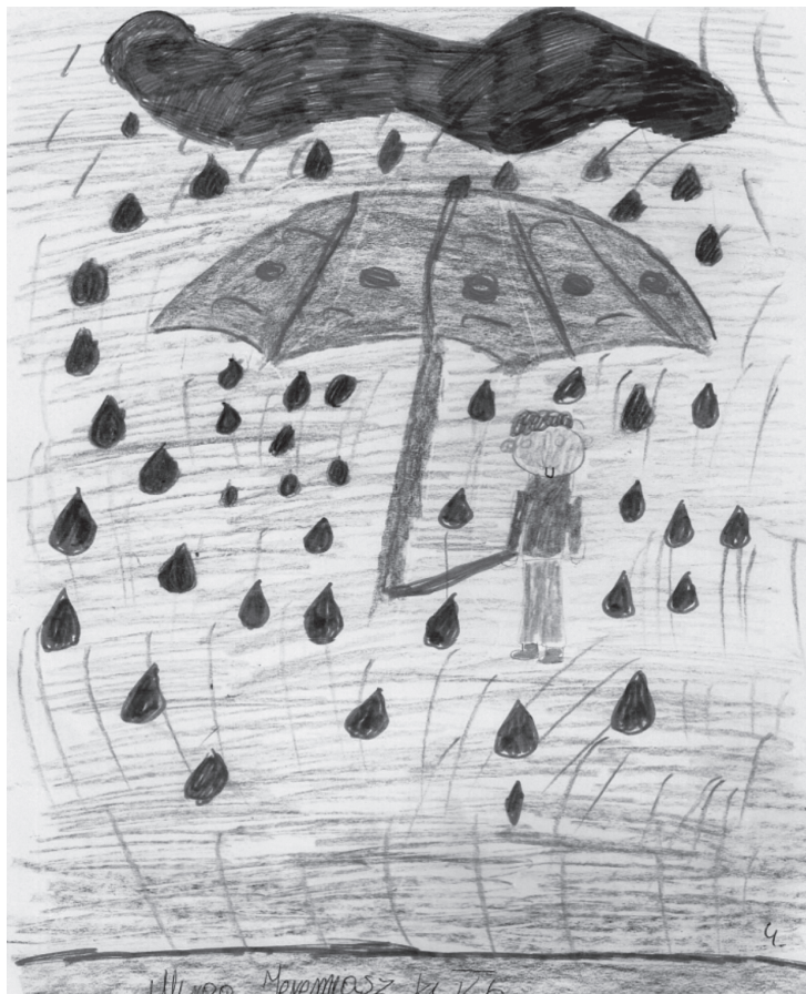
Rys. 1. Czerwony parasol na deszczu

Temat: „Czerwony parasol na deszczu” (Rys. 1)