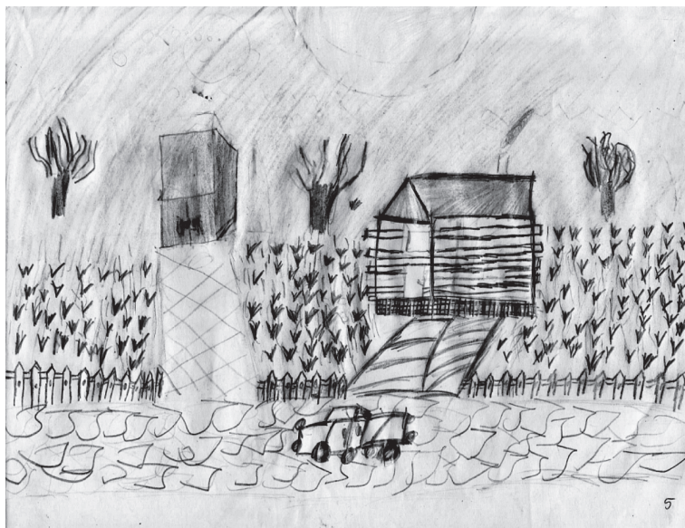
Rys. 2. Mój własny świat