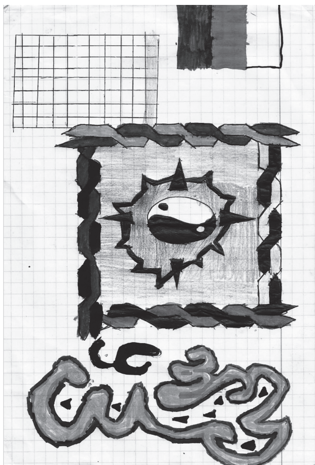
84 Rys. 3. Turystyczne ABC – poddajmy się magii starych miejsc – stworzenie konkursowego logo