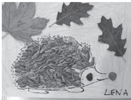
Fot. 3. Praca plastyczna wykonana przez 6-letnią dziewczynkę pt. „Jeż”