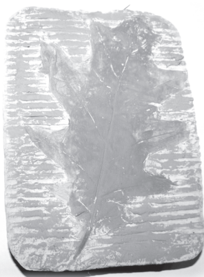
Fot. 2. Odbitka liścia w gipsie wykonana przez Kubę lat 6.

Przykłady innych prac plastycznych wykonanych przez dzieci w przedszkolu