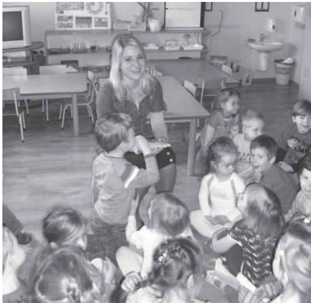
4. Rozmowa z dziećmi po wysłuchaniu opowiadania w ramach akcji „Cała Polska Czyta Dzieciom”