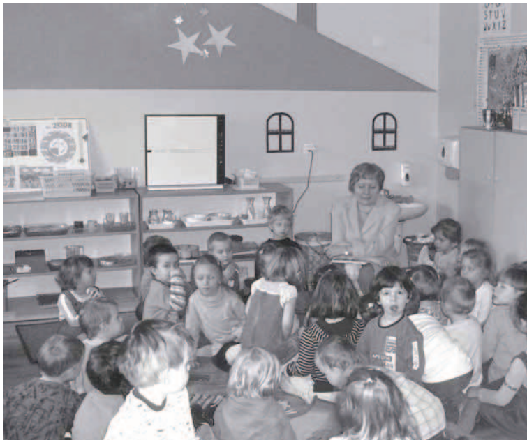
1. Czytanie bajek i opowiadań w ramach akcji „Cała Polska Czyta Dzieciom” w Przedszkolu Niepublicznym Modrzewiowa

Wszyscy chcemy, aby nasze dzieci wyrosły na mądrych, dobrych i szczęśliwych ludzi. Jest na to sposób. Czytajmy dzieciom. Głośne czytanie uczy myślenia, rozwija język, pamięć i wyobraźnię, buduje i wzmacnia więź pomiędzy dorosłym a dzieckiem, zapewnia emocjonalny rozwój dziecka, pomaga w wychowaniu, ułatwia naukę w szkole, kształtuje nawyk czytania i zdobywania wiedzy na całe życie. Jest najlepszą inwestycją w pomyślną przyszłość dziecka. Czytanie dzieciom już od najmłodszych lat rozbudza w nich ciekawość świata pomaga zrozumieć siebie i innych.