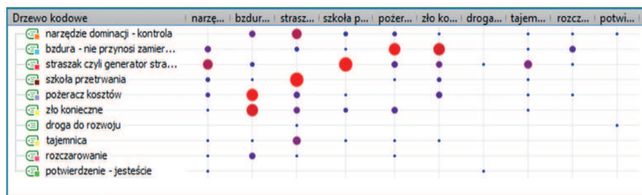
Wykres 1. Relacje między kodami

Kolorem zielonym oznaczyłam te kody, które wyrażają stosunek sprzyjający traktowaniu ewaluacji jako narzędzia rozwoju, a więc i narzędzia pełniącego funkcję wspomagającą. Kolorem żółtym oznaczyłam kody, które wyrażają stosunek neutralny lub ambiwalentny. Trudno stwierdzić, czy są związane z traktowaniem ewaluacji jako wsparcia, czy jako przeszkody w rozwoju. Niebieskim kolorem oznaczyłam kody wyrażające nastawienia negatywne, wykluczające traktowanie ewaluacji jako wsparcia.