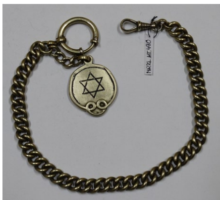
Il. 7. Dewizka typu Albert z odręcznie wrytą Gwiazdą Dawida (MRZL.HT.490)