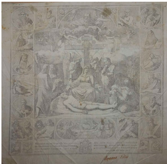
14. MAPrz V/7557