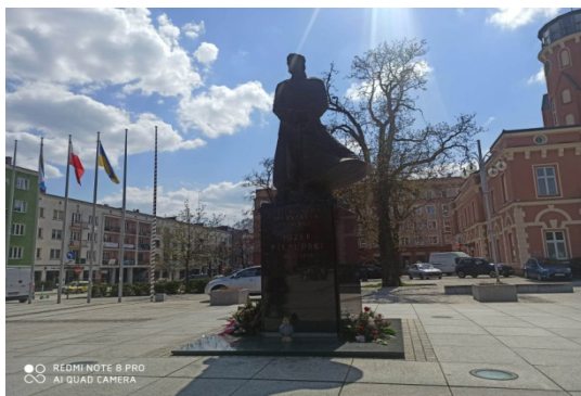
Fotografia 3. Pomnik marszałka Józefa Piłsudskiego w Częstochowie.