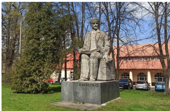
Fotografia 2. Pomnik Henryka Sienkiewicza w Częstochowie.

Dzieje budynku szkolnego nierozzerwalnie łączą się ze znaczącymi wydarzeniami w historii naszego kraju: powstaniem styczniowym i represjami po jego upadku, z epopeją Legionów Polskich Józefa Piłsudskiego oraz Polską Organizacją Wojskową, z rozbrajaniem okupantów niemieckich w listopadzie 1918 roku, z III powstaniem śląskim z 1921 roku. W czasie II wojny światowej budynek służył niemieckim wojskom okupacyjnym. Od 1945 roku w jego murach nieprzerwanie prowadzone są zajęcia szkolne 12 . Pomnik Henryka Sienkiewicza stanowi upamiętnienie wartości spuścizny literackiej autora wielu powieści historycznych oraz Trylogii , napisanej „ku pokrzepieniu serc”, na stronach której utrwalił najazd Szwedów na Polskę i bohaterską obronę Jasnej Góry.