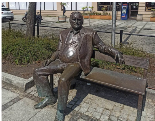
Fotografia 6. Ławeczka Marka Perepeczki w Częstochowie.

Ławeczka (2022) Piotra Machalicy przez dwanaście lat pełniącego funkcję dyrektora artystycznego Teatru im. Adama Mickiewicza w Częstochowie jest dziełem Zbigniewa Stanucha 21 . Dzięki pracy reżyserskiej Machalicy mieszkańcy uczestniczyli w koncertach i monodramatach oraz w scenicznych debiutach przygotowanych na najwyższym poziomie artystycznym (fot. 7).