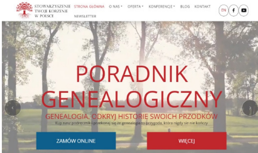
Ilustracja 6. Widok strony startowej Stowarzyszenie Twoje Korzenie w Polsce.

Obok serwisów internetowych i internetowych baz danych w Internecie funkcjonuje szereg różnego rodzaju stron internetowych, których właściciele postawili sobie za cel popularyzację badań genealogicznych. Jedną z takich stron należy do Stowarzyszenia „Twoje Korzenie w Polsce” ( www.tkwp.pl ) 20 , które zajmując się popularyzowaniem badań genealogicznych, prowadzi różne działania zmierzające do zachęcenia jak największej liczby osób do rozpoczęcia własnych poszukiwań genealogicznych, a co za tym idzie – poznania historii własnej rodziny. Z tego też powodu stowarzyszenie organizuje konferencje, webinary, spotkania i prelekcje, a także – jak czytamy na stronie internetowej – indywidualne konsultacje. Ponadto prowadzi zajęcia warsztatowe dla osób w różnym wieku: dla najmłodszych – w których chce zaszczyścić genealogicznego bakcyła, dla dorosłych, oraz dla seniorów, którym oferuje zajęcia w ramach uniwersytetu trzeciego wieku.