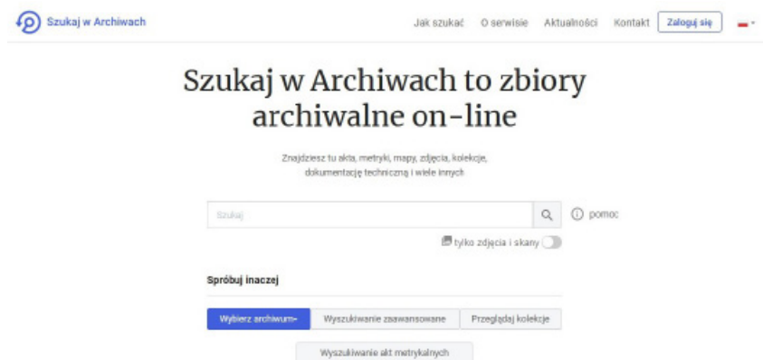
Ilustracja 1. Widok strony głównej serwisu Szukaj w Archiwach. Źródło: www.szukajwarchiwach.gov.pl (dostęp: 02.01.2024)

państwowych, w tym m.in. Archiwum Nauki PAN i PAU, Archiwum Polskiej Prowincji Dominikanów, Archiwum Akt Dawnych Diecezji Toruńskiej, Archiwum Uniwersytetu Jagiellońskiego, Papieski Instytut Studiów Kościelnych w Rzymie oraz Polski Instytut Naukowy w Ameryce. Tym samym jest to największa polska baza internetowa publikująca skany archiwaliów, w tym dokumentów niezbędnych do poszukiwań genealogicznych.