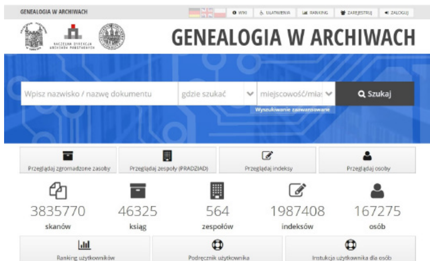
Ilustracja 3. Widok strony głównej serwisu Genealogia w Archiwach. Źródło: www.genealogiawarchiwach.pl (dostęp: 02.01.2024)

Zgodnie z informacjami zawartymi w serwisie w ramach realizacji projektu wykonano 1,8 mln skanów, co odpowiadało znaczącej części akt metrykalnych zgromadzonych w obu archiwach. Obecnie w serwisie znajduje się niemal 4 mln skanów z ponad 46 tys. ksiąg zgromadzonych w 564 zespołach archiwalnych. Wciąż jednak trwa indeksacja, bowiem w widocznym w serwisie komunikacie oba archiwa zachęcają wszystkich zainteresowanych do aktywnego włączenia się w realizację projektu w zakresie tworzenia/wypełniania baz indeksowych z zeskanowanych dokumentów genealogicznych. „Wystarczą – czytamy w komunikacie – tylko dostęp do komputera i Internetu, a także trochę umiejętności w odczytywaniu starych dokumentów”.