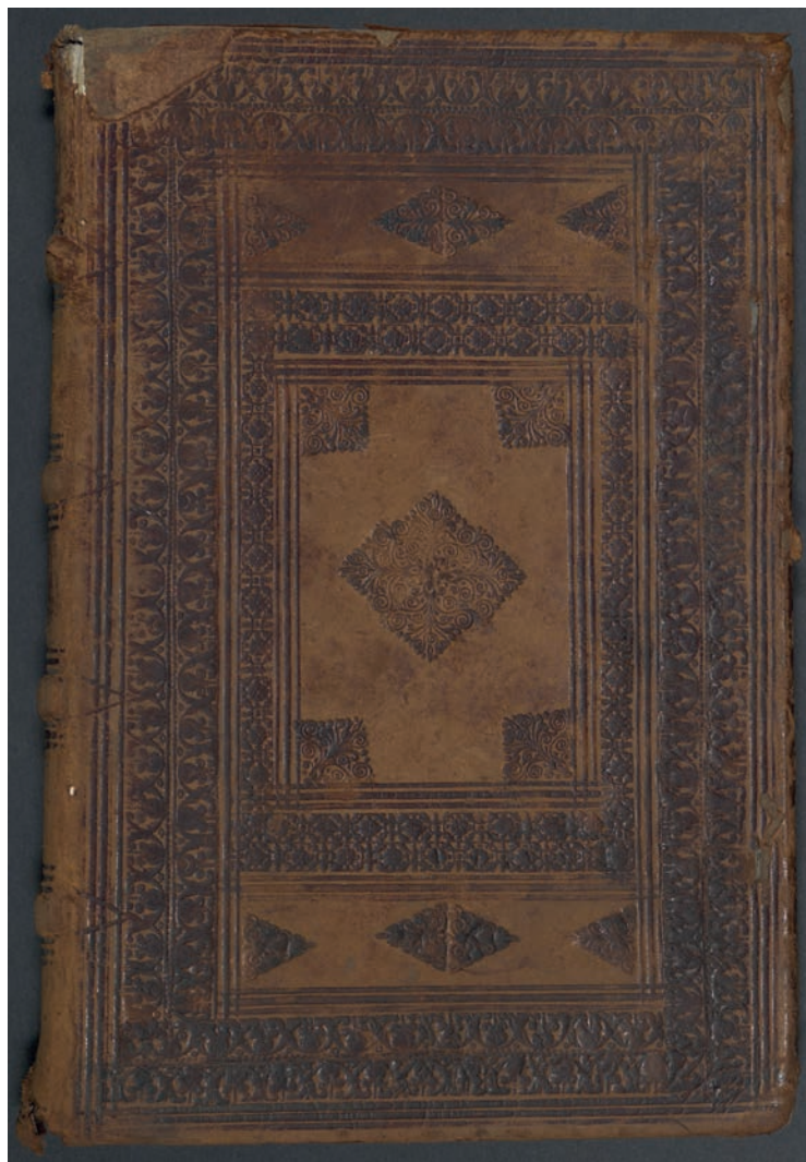
Ilustracja 1. Zbiór dramatów – oprawa, widok z przodu (APO)

Najpełniejszy i aktualny opis dziejów szkół jezuickich w Nysie znajdziemy w monografii autorstwa Kazimierza Doli 6 . W tym niezwykle dogłębnym studium, obejmującym lata 1622–1776, nie brakuje również opisu funkcjonowania teatru szkolnego. Autor opracowania, bazując na szerokiej podstawie źródłowej, wspominał również o opisywanym tutaj rękopisie.