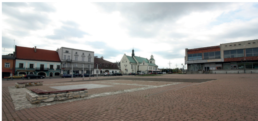
Fotografia 4. Pierwsza próba rewitalizacji Starego Rynku. Płyta wyłożona czerwoną kostką brukową. Zarys średniowiecznego ratusza wyłożony białoszarymi kostkami. Widok na kościół św. Zygmunta. Fot. aut.

Pierwsze prace rewitalizacyjne podjęto pod koniec XX wieku. Wówczas płytę rynku wyłożono czerwoną kostką brukową, eksponując zarys średniowiecznego ratusza przy użyciu białoszarej kostki kamiennej. Spadek płaszczyzny rynku wyprofilowano od strony południowej w postaci zanikających stopni zachęcających do odpoczynku. W strefie tej, w płaszczyźnie płyty rynku wprowadzono również pole szachowe, które miało zachęcić mieszkańców do aktywności (fot. 4).