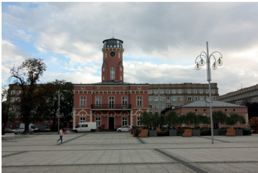
Fotografia 2. Ściana południowa placu Biegańskiego. Płyta placu z historycznymi obiektami Ratusza i Odwachu. W tle pierzeje kwartałów zabudowy z architekturą okresu socrealizmu.

Przestrzeń placu płynnie wtapia się w przylegające do placu odcinki głównej arterii – Alei N.M.P. Pozostałe, równie wyjątkowe struktury kulturowe otaczające przestrzeń placu to historyczne obiekty Ratusza i Odwachu (od strony południowej) i założenie parkowe wraz z kościołem św. Jakuba (od strony północnej) 24 (fot. 2–3). Płyta placu z jednej strony dystansuje przylegające obiekty należące do strefy sacrum i profanum i wzbogaca przestrzeń pomiędzy nimi, w sposób czytelny odwołując się do zastanego otoczenia, jego przeszłości i teraźniejszości. Z drugiej strony przestrzeń placu, jego skala i forma integruje strefy sacrum i profanum, pozwalając na ich swobodne przenikanie i oddziaływanie.