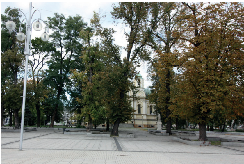
Fotografia 3. Ściana północna placu Biegańskiego z historycznym obiektem kościoła św. Jakuba (XIX wiek) w otoczeniu założenia parkowego.

Religijność i świeckość, sfera świętości i codzienności przenikające nieustannie życie częstochowian stworzyły miejsce wyjątkowe, w którym przenikanie to ma magiczny wymiar. Percepcja odbioru znaczeń zawartych w formach architektonicznych budowli i otaczających je przestrzeniach daje poczucie akceptacji tradycji i nowego porządku. Przynosi również poczucie bezpieczeństwa, co umożliwia otwarcie się na przestrzeń placu i na jego kontemplację 25 .