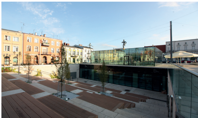
Fotografia 5. Płyta Starego Rynku – współczesna rewitalizacja. Szklany pawilon łączy funkcję muzealną z funkcją kawiarni i z częścią amfiteatralną.

Szklany pawilon to istotny symbol łączący terażniejszość z przeszłością. Obiekt wpisuje się w otoczenie poprzez osadzenie na średniowiecznych murach ratusza. Umieszczony pod płytą rynku rezerwat archeologiczny prezentuje artefakty w miejscu ich odkrycia. Uczy historii tego miejsca i szacunku do niego. Dodatkową formą ekspozycji jest przestrzeń amfiteatralna z widokiem na relikty piwnic średniowiecznego ratusza. Wykreowana wyjątkowa przestrzeń i scenografia służą do realizacji projektów muzycznych, teatralnych, artystycznych.